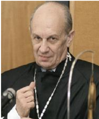
В.А. Туманов – Председатель Конституционного суда Российской Федерации 13 февраля 1995 – 20 февраля 1997 г.