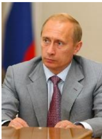
В.В. Путин – Председатель Правительства Российской Федерации 16 августа 1999 г. – 7 мая 2000 г.