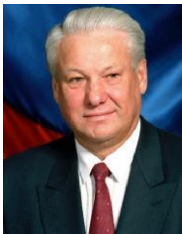
Б.Н. Ельцин – Глава правительства Российской Федерации как Президент Российской Федерации с 6 ноября 1991 г. по 15 июня 1992 г.