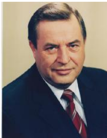
Г.Н. Селезнев – Председатель Государственной Думы II созыва с 17 декабря 1996 года – 18 января 2000 года Председатель Государственной Думы III созыва с 19 декабря 1999 года – 7 декабря 2003 года