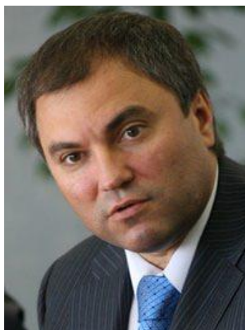
В.В. Володин – Председатель Государственной Думы Федерального Собрания Российской Федерации с 5 октября 2016 года