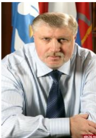
С.М. Миронов – Председатель Совета Федерации Федерального Собрания Российской Федерации 5 декабря 2001 года – 18 мая 2011 года