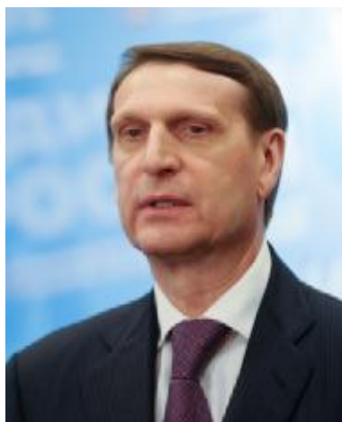
С.Е. Нарышкин – Председатель Государственной Думы Федерального Собрания Российской Федерации 21 декабря 2011 года – 5 октября 2016 года