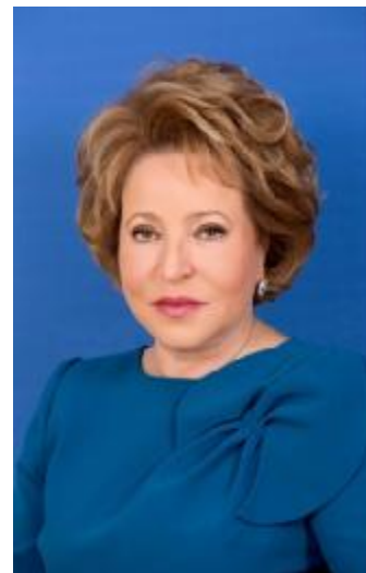
В.И. Матвиенко – Председатель Совета Федерации Федерального Собрания Российской Федерации с 21 сентября 2011