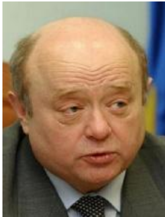
М.Е. Фрадков – Председатель Правительства Российской Федерации 5 марта 2004 – 12 сентября 2007