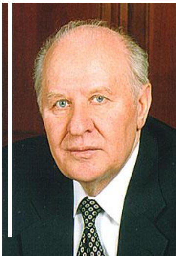
Е.С. Строев Председатель Совета Федерации Федерального Собрания Российской Федерации 23 января 1996 – 5 декабря 2001