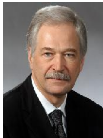
Б.В. Грызлов – Председатель Государственной думы Федерального собрания Российской Федерации 29 декабря 2003 – 14 декабря 2011