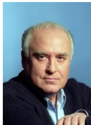
В.С. Черномырдин – Председатель Совета Министров РФ с 14 декабря 1992 г. С 25 декабря 1993 г. – Председатель Правительства РФ (до 23 марта 1998 г.)