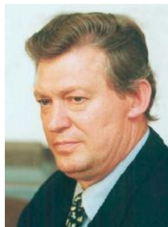
В.Ф. Шумейко – Председатель Совета Федерации Федерального Собрания Российской Федерации 13 января 1994 – 23 января 1996