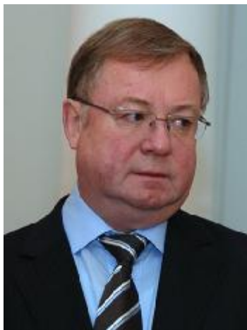
С.В. Степашин – Председатель Правительства Российской Федерации 12 мая – 9 августа 1999 года