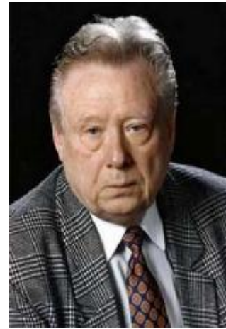
М.В. Баглай – Председатель Конституционного суда Российской Федерации 20 февраля 1997 года – 21 февраля 2003 года