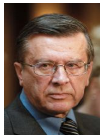
В.А. Зубков – Председатель Правительства Российской Федерации 14 сентября 2007 г. – 7 мая 2008 г.

С 8 мая 2008 г. по 7 мая 2012 г. Председателем Правительства Российской Федерации был В.В. Путин