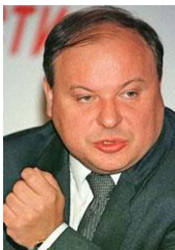
Е.Т. Гайдар – И.о. председателя Правительства Российской Федерации с 15 июня по 15 декабря 1992 г.