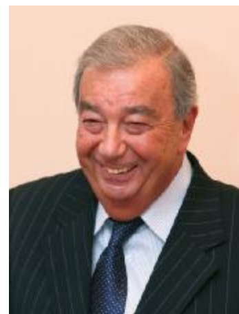
Е.М. Примаков – Председатель Правительства Российской Федерации 11 сентября 1998 г. – 12 мая 1999 г.