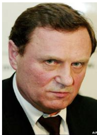
И.П. Рыбкин – Председатель Государственной думы Федерального Собрания Российской Федерации 14 января 1994 – 17 января 1996