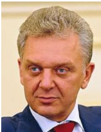
В.Б. Христенко – и.о. Председателя Правительства Российской Федерации 24 февраля 2004 года – 5 марта 2004 года